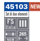
Set di due carri FS Tipo F con doghe orizzontali. Set of two Type F Italian Railways goods wagon with horizontal slats. Set aus zwei FS Typ F-Güterwagen mit horizontalen Lamellen.